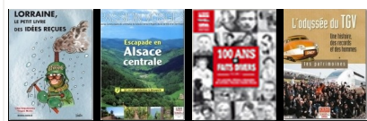
Les hors-séries et autres publications